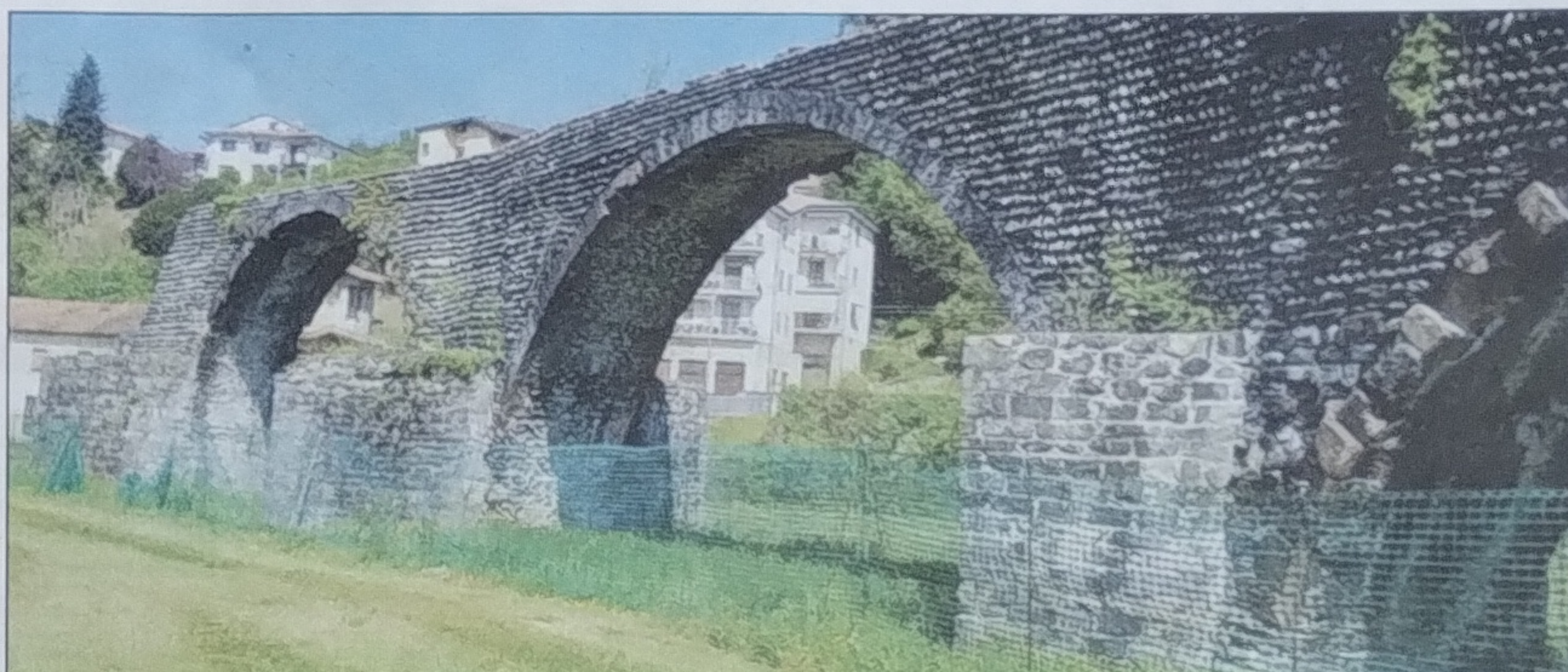
Una bella veduta dell'opera ingegneristica